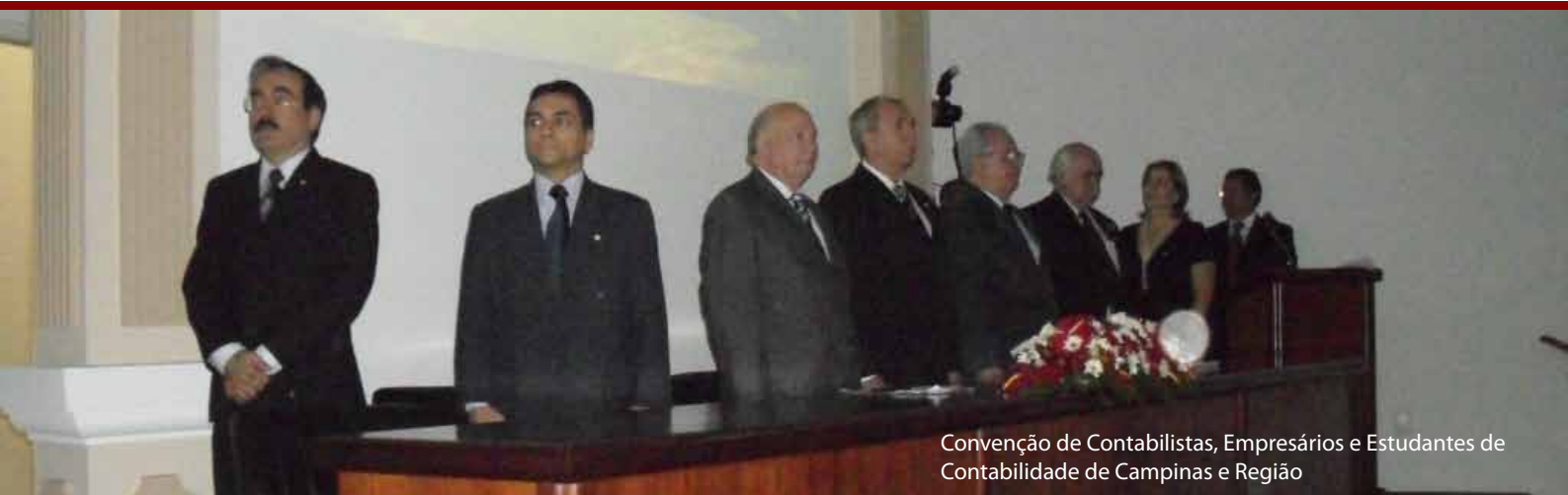
Convenção de Contabilistas, Empresários e Estudantes de Contabilidade de Campinas e Região

ser humano sofre influência dos elementos naturais no caráter. “Uma semente necessita de terra, água, ar e luz solar para se manifestar e florescer. Nós funcionamos da mesma forma. A ausência ou o excesso de algum dos elementos pode provocar desequilíbrios físicos, mentais ou emocionais”, explicou Suziganm.