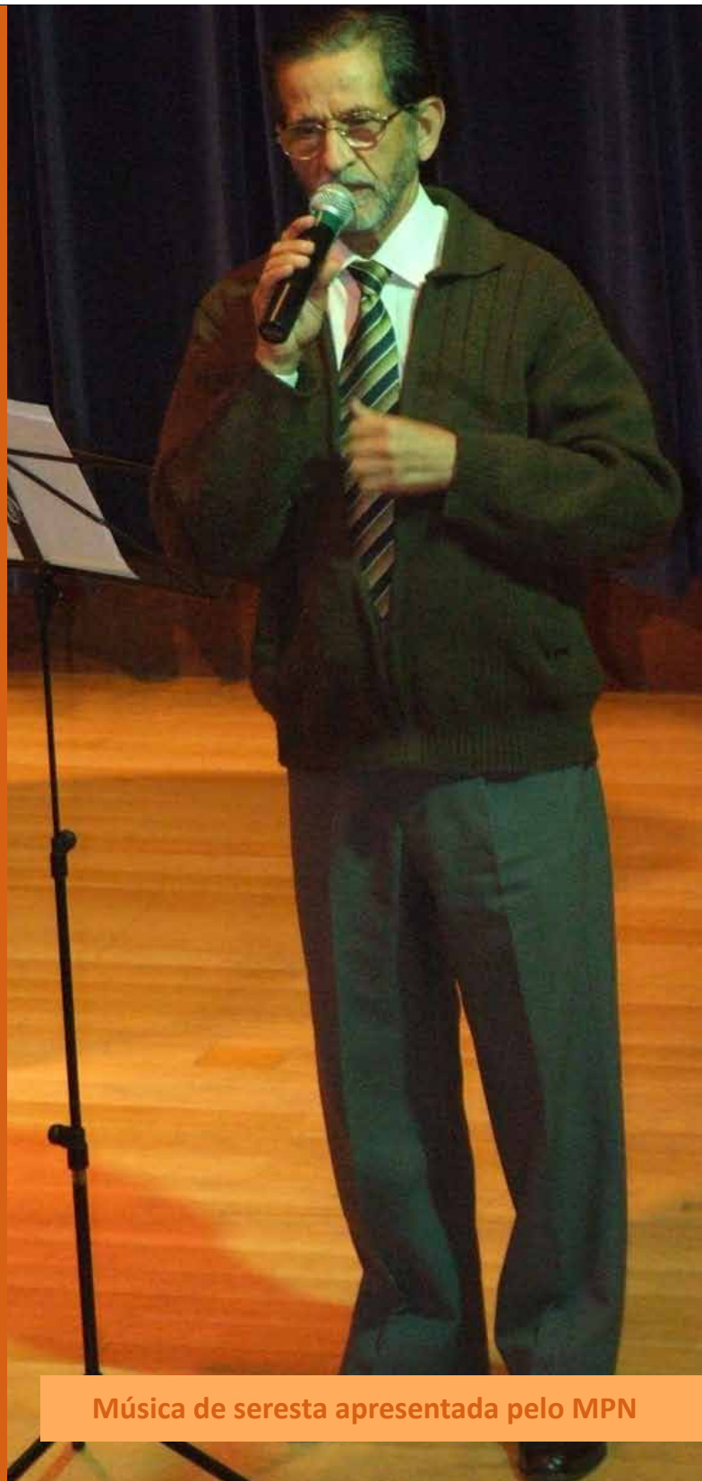
Música de seresta apresentada pelo MPN

As figuras da escultora e pintora, que foi premiada pela Fundação Bienal de São Paulo em 2008, ficaram expostas no Espaço Cultural CRC SP até 29 de abril.