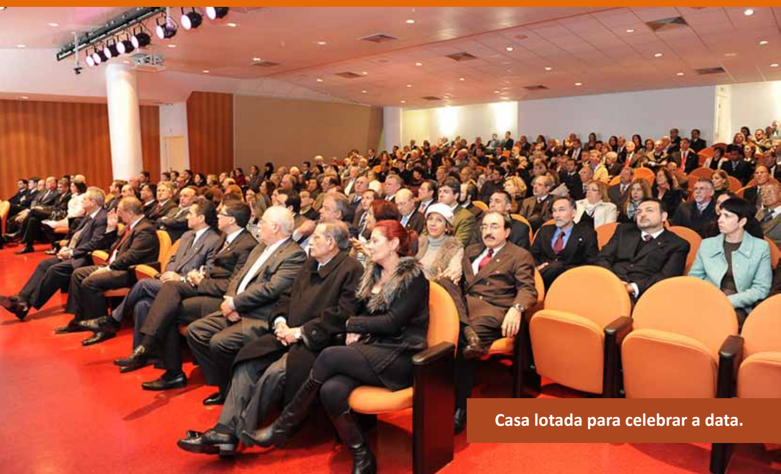
Casa lotada para celebrar a data.

A Medalha Joaquim Monteiro de Carvalho é um reconhecimento pelo trabalho e dedicação “na liderança da classe em associações profissionais, em sindicatos, em entidades con-