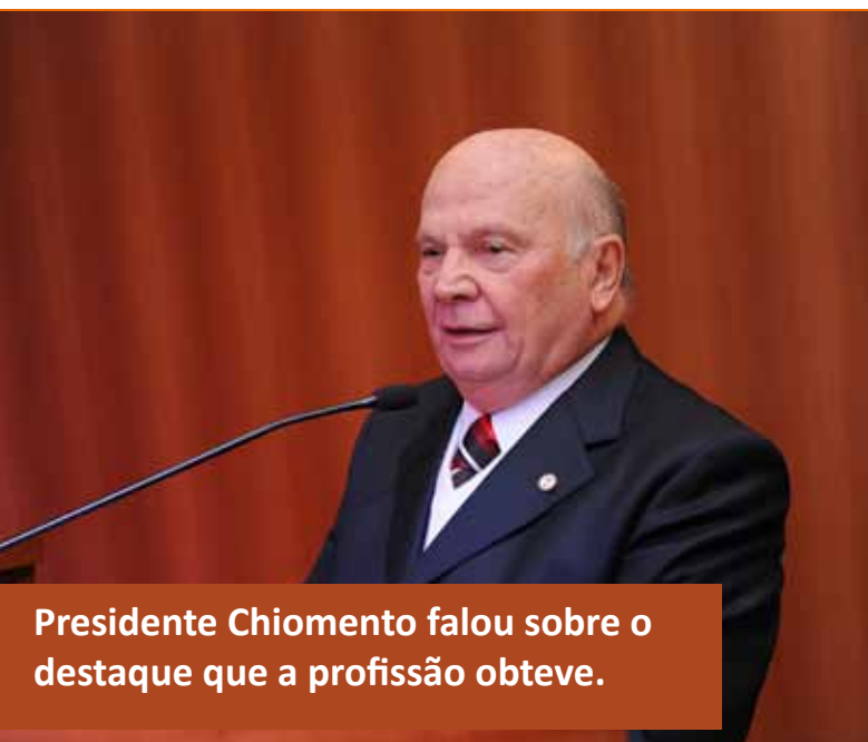
Presidente Chiomento falou sobre o destaque que a profissão obteve.