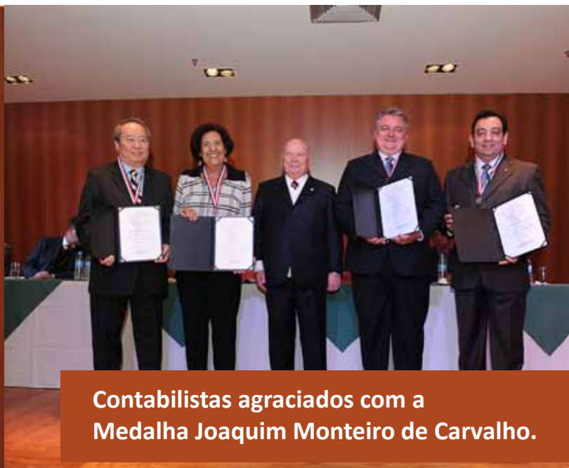
Contabilistas agraciados com a Medalha Joaquim Monteiro de Carvalho.