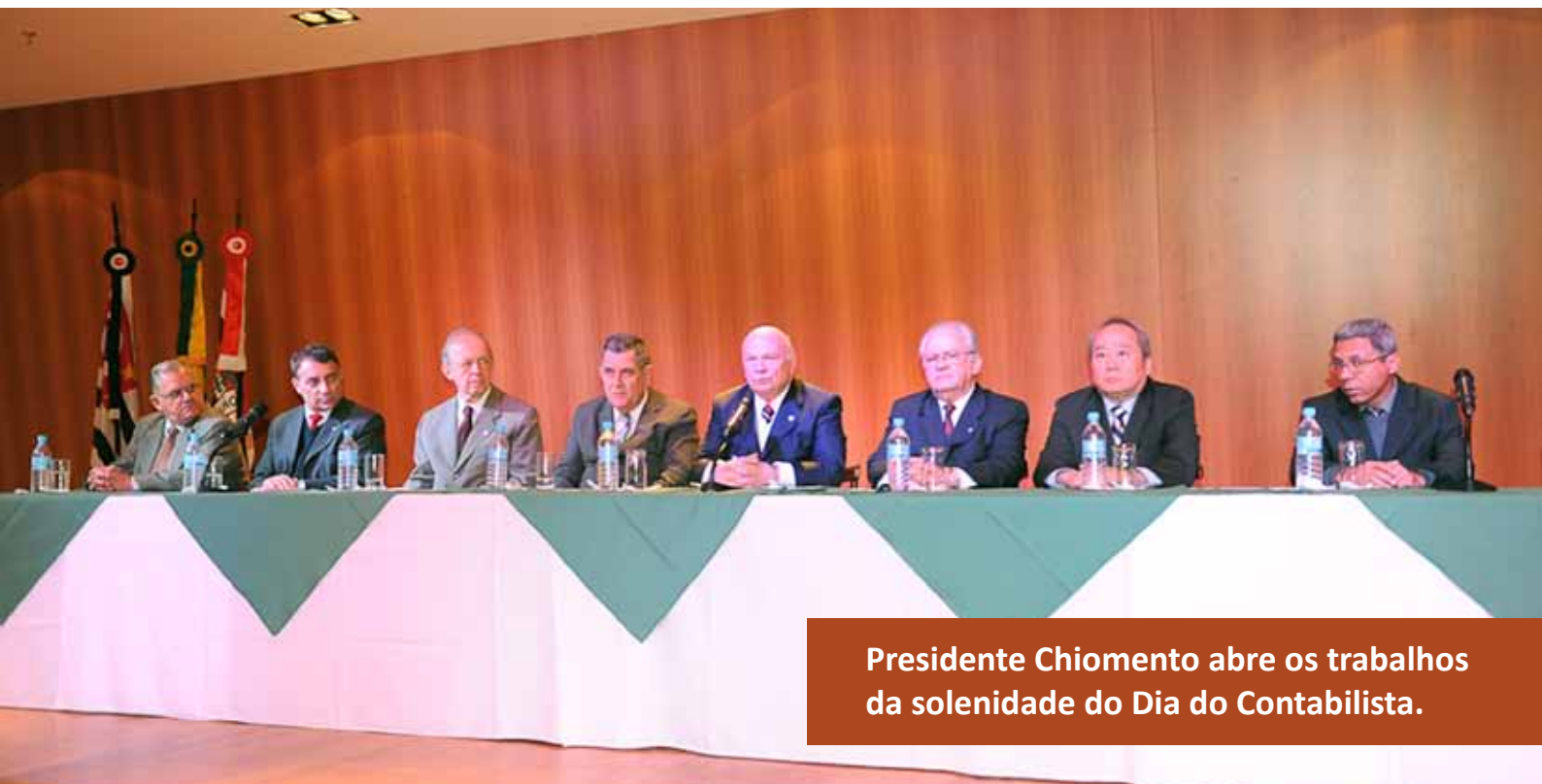
Presidente Chiomento abre os trabalhos da solenidade do Dia do Contabilista.

Em meio à crescente valorização da profissão, o CRC SP realizou sessão solene, no dia 30 de maio de 2011, em homenagem ao Dia do Contabilista. A data, instituída pelo senador e patrono dos Contabilistas, João Lyra, é celebrada em 25 de abril.