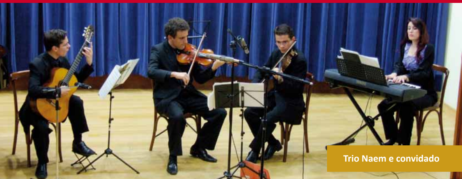
Trio Naem e convidado

O Trio Naem apresentou-se acompanhado de um músico convidado. O repertório tinha composições clássicas