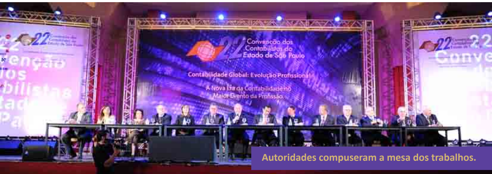
Autoridades compuseram a mesa dos trabalhos.

A abertura oficial da 22ª Convenção dos Contabilistas do Estado de São Paulo aconteceu na noite de 17 de agosto de 2001. Classificada pelos presentes como uma solenidade de gala, a cerimônia reuniu no Mendes