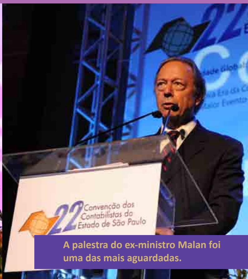
A palestra do ex-ministro Malan foi uma das mais aguardadas.