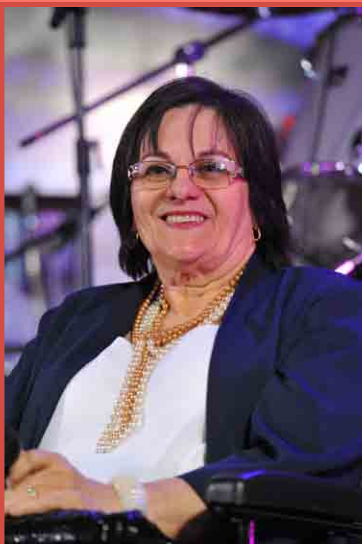
Maria da Penha

Batalhadora, a farmacêutica Maria da Penha Maia Fernandes tornou pública sua história de violência doméstica. Após sofrer duas tentativas de assassinato cometidas por seu ex-marido, Maria da Penha, que ficou paraplégica, relatou em um livro sua luta pela punição de seu agressor. Ele ficou preso por apenas dois anos, mas o caso desta cearense fez com que o Brasil fosse denunciado à Comissão Interamericana de Direitos Humanos da OEA (Organização dos Estados Americanos) por negligência no combate a violência contra a mulher. A condenação resultou na promulgação da Lei nº 11.340, em 7 de agosto de 2006, que, numa justa homenagem, é conhecida como Lei Maria da Penha.