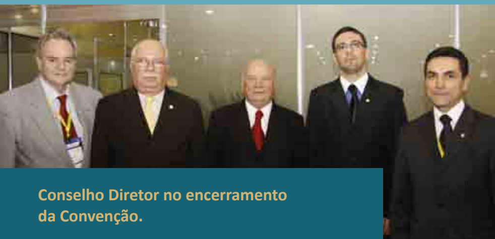
Conselho Diretor no encerramento da Convenção.

“Foram três dias que valeram por anos de aprendizado por tudo o que recebemos de informação, especialmente sobre a aplicabilidade das Normas Internacionais de Contabilidade no Brasil. O evento foi um sucesso!”