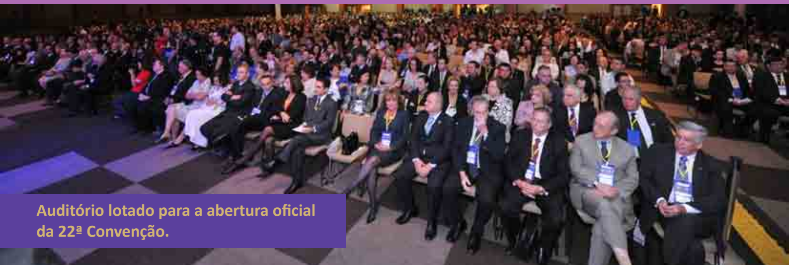
Auditório lotado para a abertura oficial da 22ª Convenção.

Personalidades do mundo contábil, empresarial e político assistiram à