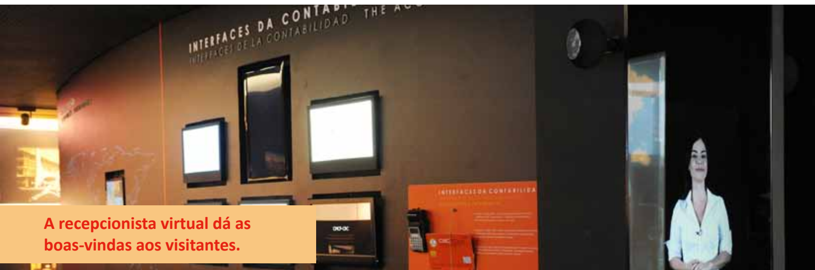
A recepcionista virtual dá as boas-vindas aos visitantes.

virtualmente objetos antigos que eram utilizados no dia a dia por Contabilistas.