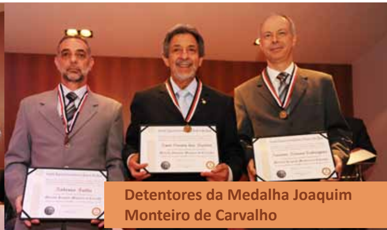
Detentores da Medalha Joaquim Monteiro de Carvalho

trabalho e dedicação na liderança em associações profissionais, sindicatos, entidades contábeis, atividades dos setores público, político ou privado e àqueles que se distinguiram ou obtiveram projeção da militância da profissão contábil.