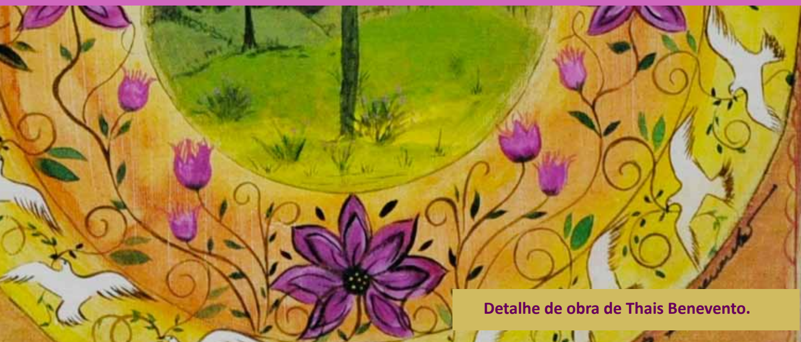
Detalhe de obra de Thais Benevento.

e presidente do IPH, Emanuel von Lauenstein Massarani, “a artista traduz, por meio de um cromatismo forte e ao mesmo tempo racional a continuidade quase mística da natureza. A ressonância emotiva e o sóbrio equilíbrio de luzes envolvem a sua fantasiosa e expressiva temática”.