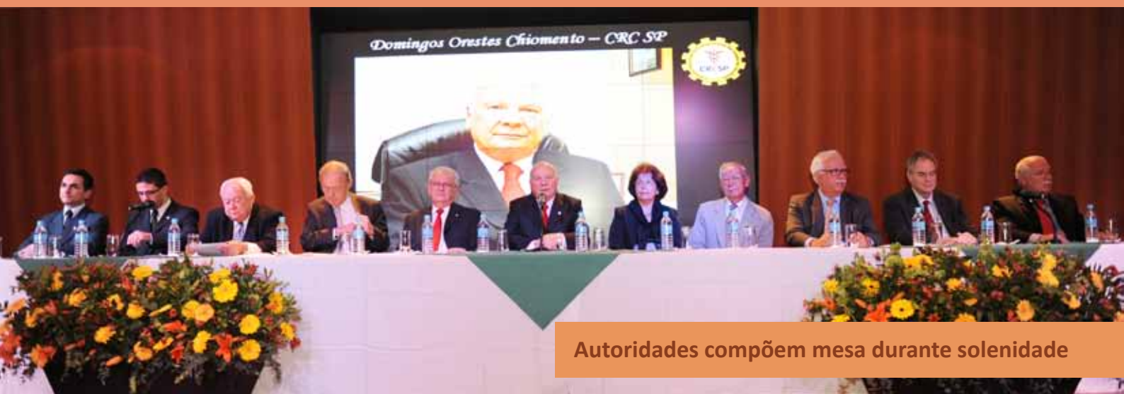
Autoridades compõem mesa durante solenidade

Após a reinstalação da Academia, ocorreu a entrega de medalhas. A Medalha Joaquim Monteiro de Carvalho é um reconhecimento pelo