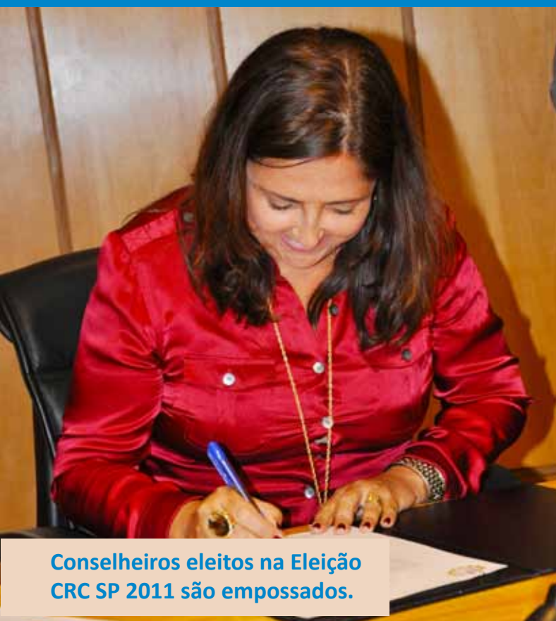
Conselheiros eleitos na Eleição CRC SP 2011 são empossados.