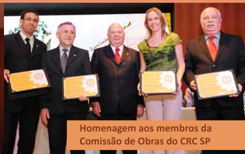
Homenagem aos membros da Comissão de Obras do CRC SP