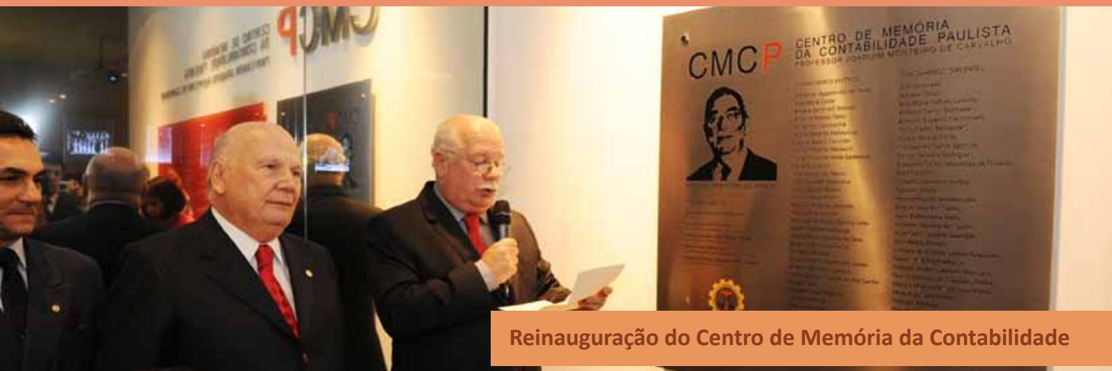
Reinauguração do Centro de Memória da Contabilidade

Na solenidade de comemoração dos 65 anos de instalação do CRC SP, os presentes foram para os Contabilistas e para a sociedade. O Centro de Memória da Contabilidade Paulista Professor Joaquim Monteiro de Carvalho foi reinstalado e a Academia Paulista de Contabilidade, recriada, no dia 12 de dezembro de 2011.