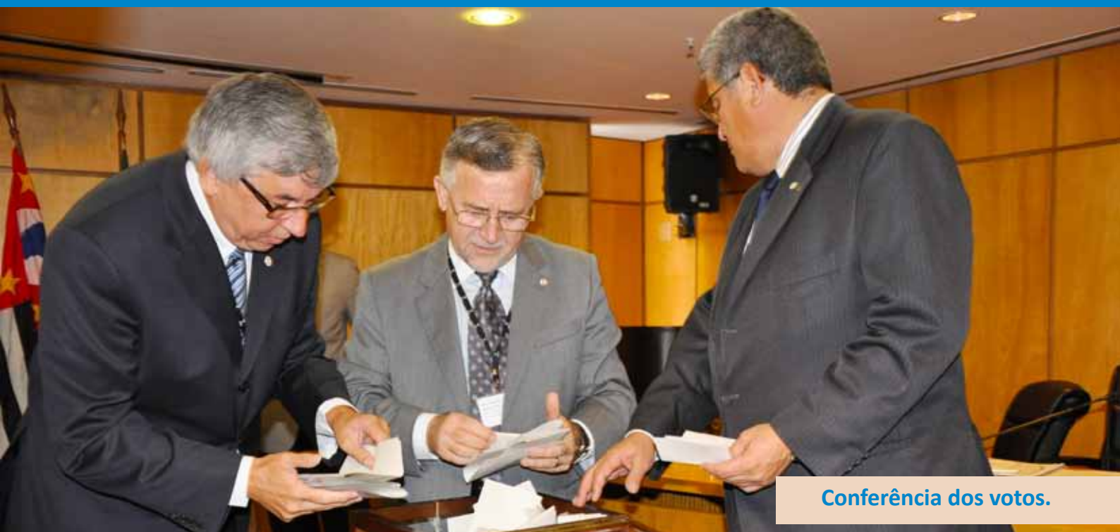
Conferência dos votos.

“Temos pela frente grandes desafios: o de ampliar os instrumentos que permitam aos profissionais a oportunidade da reciclagem, da inserção nas Normas Internacionais de Contabilidade. Vamos continuar a fazer o que deu certo e aperfeiçoar canais que nos permitam ouvir para servir melhor”.