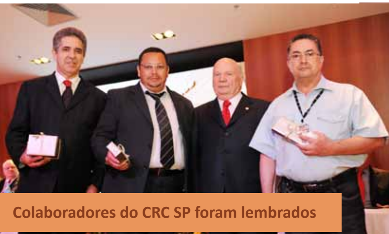
Colaboradores do CRC SP foram lembrados