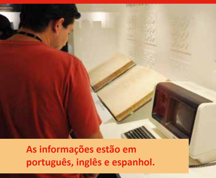
As informações estão em português, inglês e espanhol.