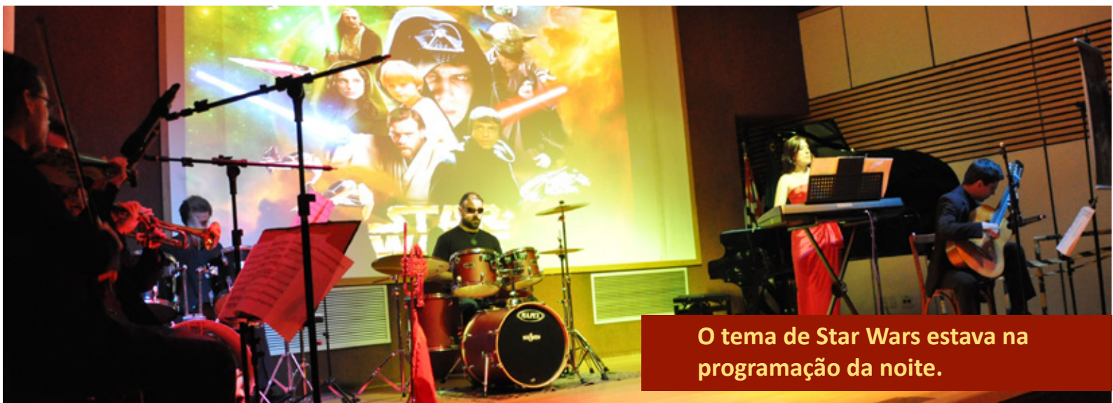
O tema de Star Wars estava na programação da noite.

fez cursos de desenho e pintura aquarela, óleo e pastel. Por seu talento, foi incluída no Dicionário Brasileiro de Artistas Plásticos , editado pelo Instituto Nacional do Livro do Ministério da Educação, e suas obras foram premiadas com