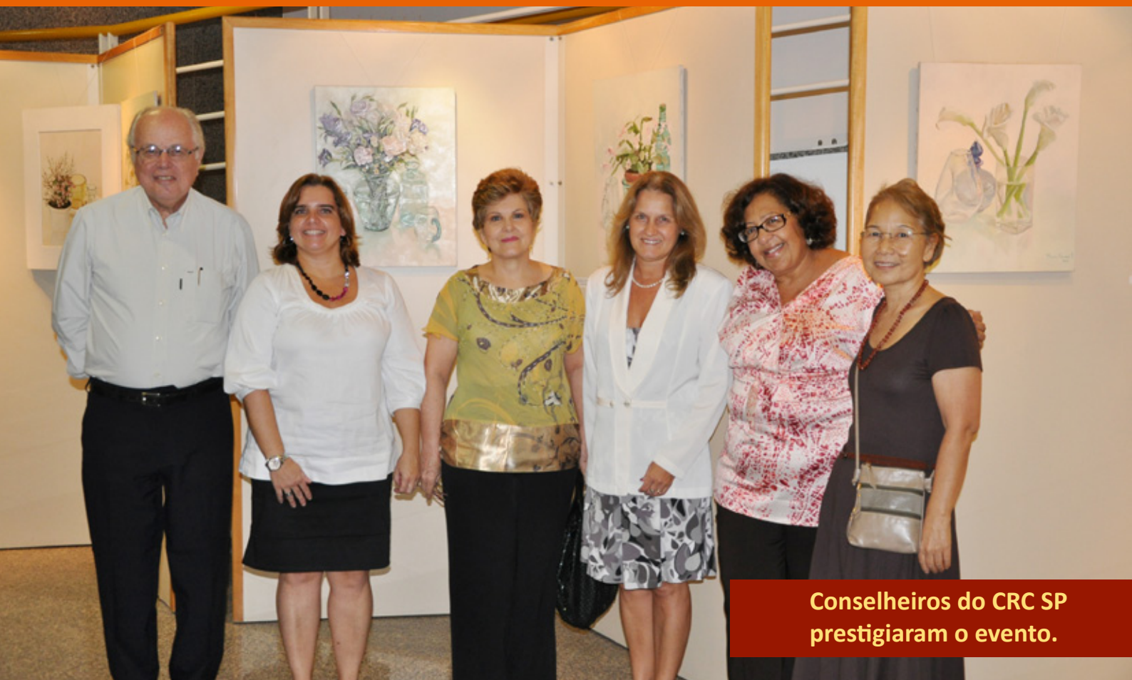
Conselheiros do CRC SP prestigiaram o evento.

O Espaço Cultural CRC SP fica aberto ao público de segunda a sexta-feira, das 9h às 17h. A entrada é gratuita.