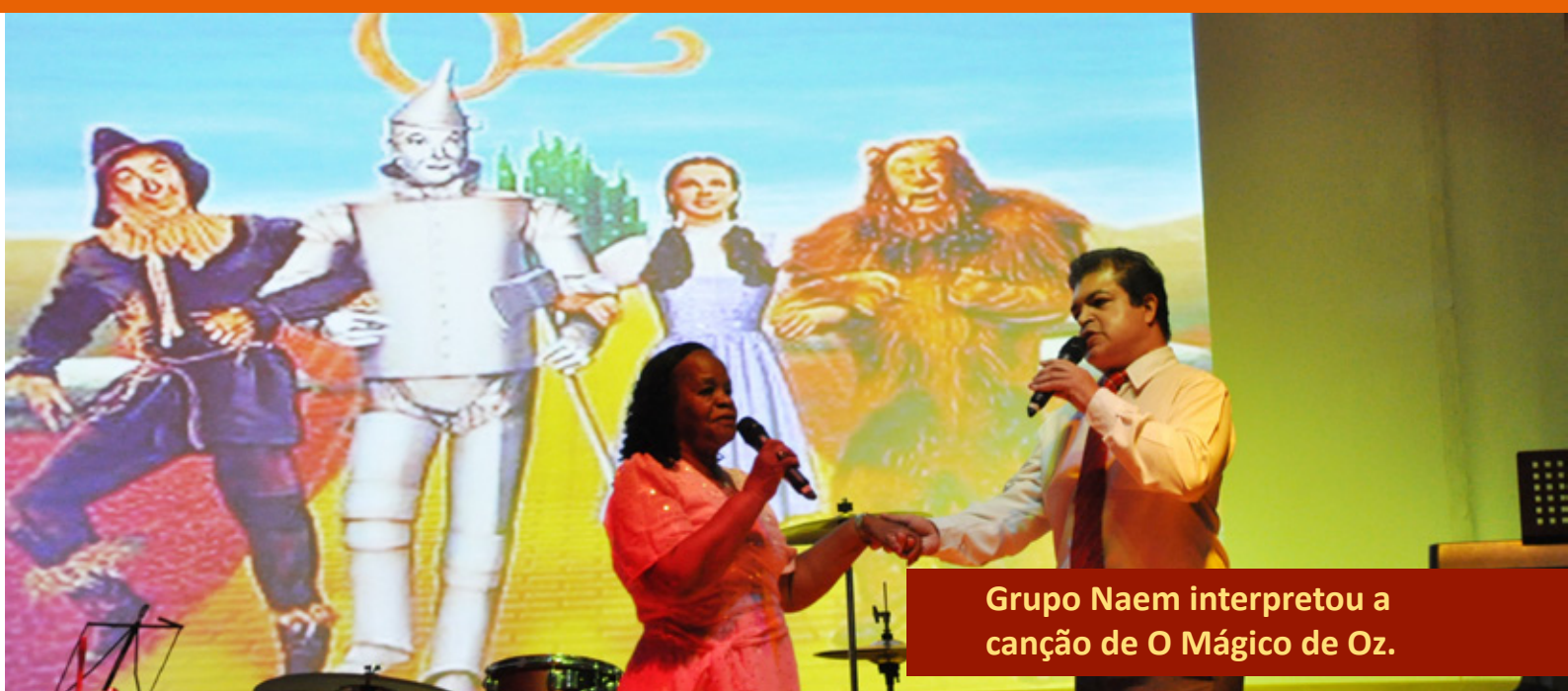
Grupo Naem interpretou a canção de O Mágico de Oz.

A abertura da exposição foi acompanhada da apresentação “Temas Inesquecíveis do Cinema – Sucessos que Marcaram Época”, do Naem