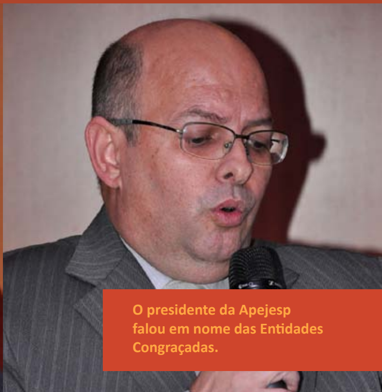
O presidente da Apejesp falou em nome das Entidades Congraçadas.