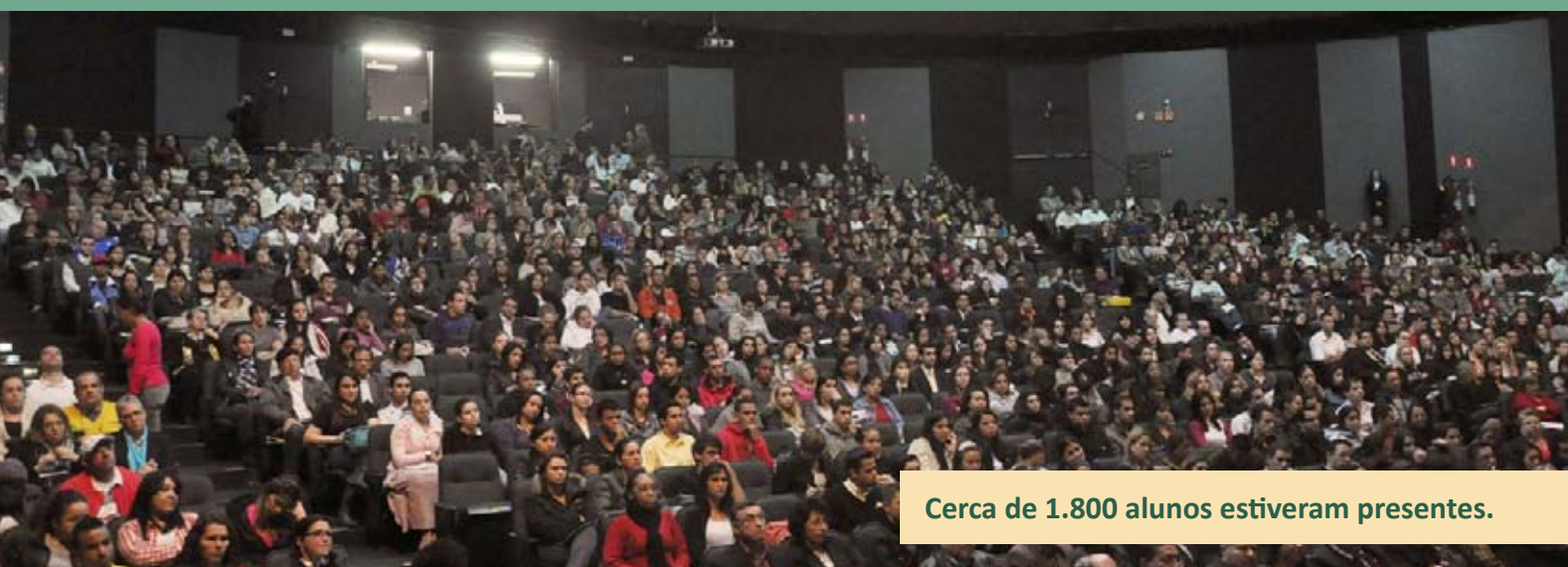
Cerca de 1.800 alunos estiveram presentes.