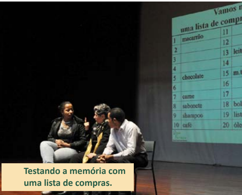
Testando a memória com uma lista de compras.