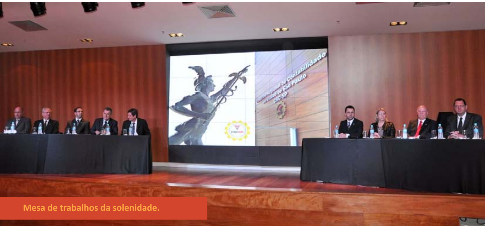
Mesa de trabalhos da solenidade.

Uma cerimônia solene com muitos momentos de descontração marcou a homenagem do CRC SP ao Dia do Profissional da Contabilidade. A data é comemorada em 25 de abril, mas foi festejada pelo Conselho no dia 14 de maio de 2012.