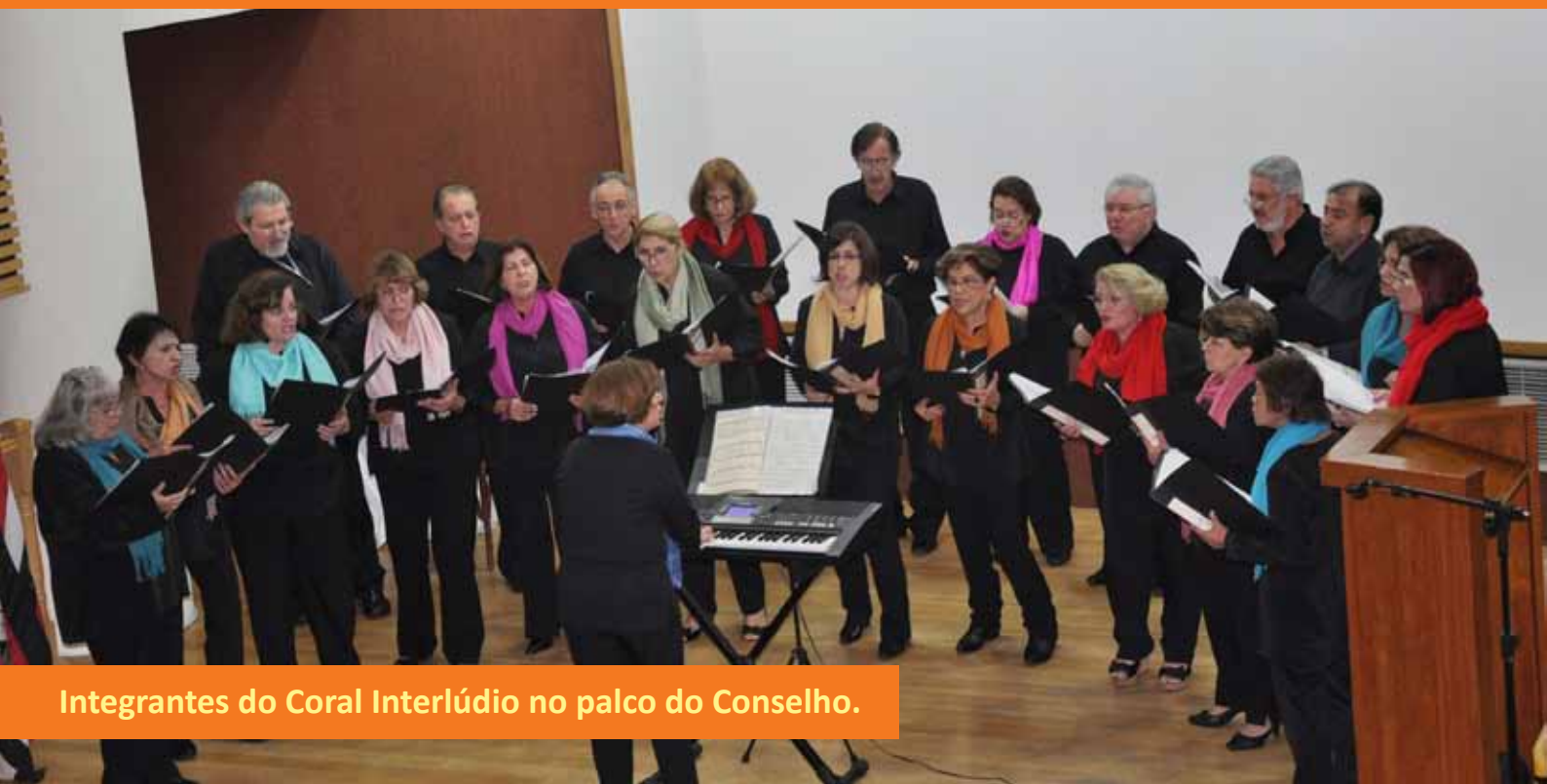
Integrantes do Coral Interlúdio no palco do Conselho.

Os convidados doaram alimentos perecíveis, que foram encaminhados a entidades beneficentes.