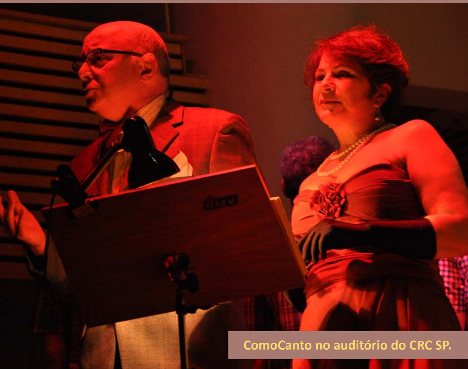
ComoCanto no auditório do CRC SP.